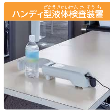
ハンディ型液体検査装置