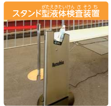
スタンド型液体検査装置

万博でもこれらのセキュリティ製品が使われました。過去に日本で開催されたサミットでも使われています。