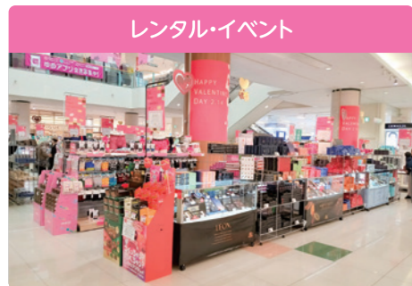
レンタル・イベント