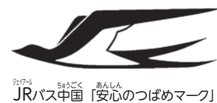
JRバス中国「安心のつばめマーク」

バスが安全に運行できるか、整備係がしっかりと点検し、必要に応じて修理も行います。